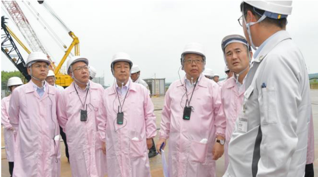
キオクシア株式会社工場視察

私が事務局長を務める党半導体基盤強化プロジェクトチームで、データを記録する半導体フラッシュメモリーの世界最大級の製造工場であるキオクシア株式会社工場を視察。幅広い産業に不可欠な半導体はデジタル化の進展に伴い世界的な需要拡大が見込まれており、国内における半導体の安定した製造基盤の構築に向けた課題を探りました。 また、長崎県の佐世保工業高等専門学校を地元市議団と訪問し、半導体製造に関わる人材育成事業や水素研究等について意見交換しました。党を挙げて半導体の基盤強化に全力で取り組んでまいります。